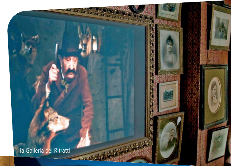
la Galleria dei Ritratti