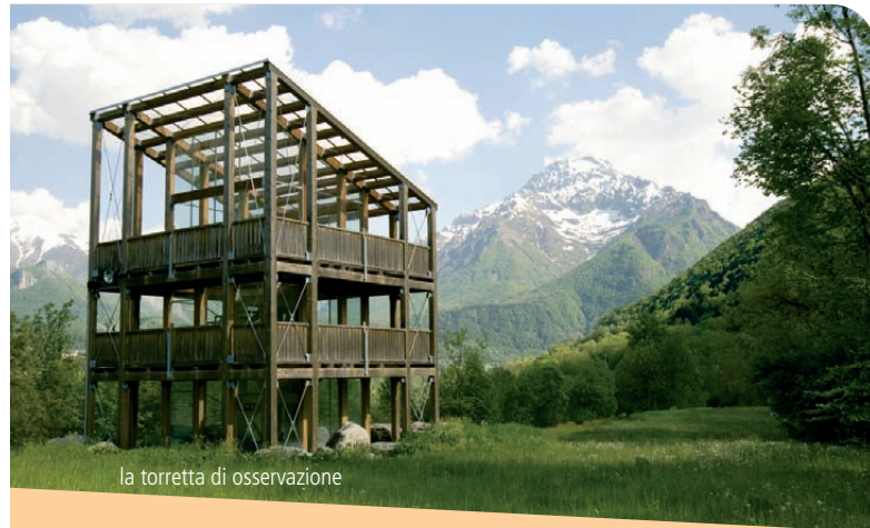
la torretta di osservazione

Dal contatto con tutti questi personaggi emerge una morale solo in apparenza scontata: il lupo non è né buono né cattivo, il lupo attacca altri animali perché così vuole il suo istinto, perché quella è la parte che gli è stata assegnata nella grande rappresentazione del ciclo della vita.