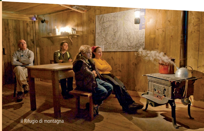
il Rifugio di montagna

Alla torretta si giunge attraverso un tunnel al cui interno si snoda un percorso di visita che presenta il lupo dal punto di vista naturalistico. Insieme al recinto e al tunnel in località Casermette , posizionati presso la sede operativa del Parco delle Alpi Marittime, il Centro faunistico Uomini e Lupi comprende un secondo spazio espositivo nel paese di Entracque , dedicato al rapporto uomo-lupo.