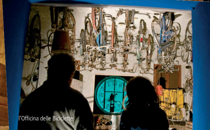
l'Officina delle Biciclette